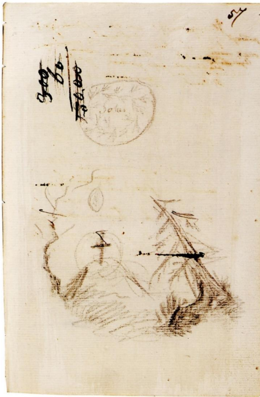
Пушкин. Могила Гостомысла. Рисунок в ПД 830. Л. 57. 1821 или 1822 год. Сверху западноевропейская монетка с надписью Solus (Солид или Соль). Ниже изображение овальной древнерусской копейки («чешуйки»).