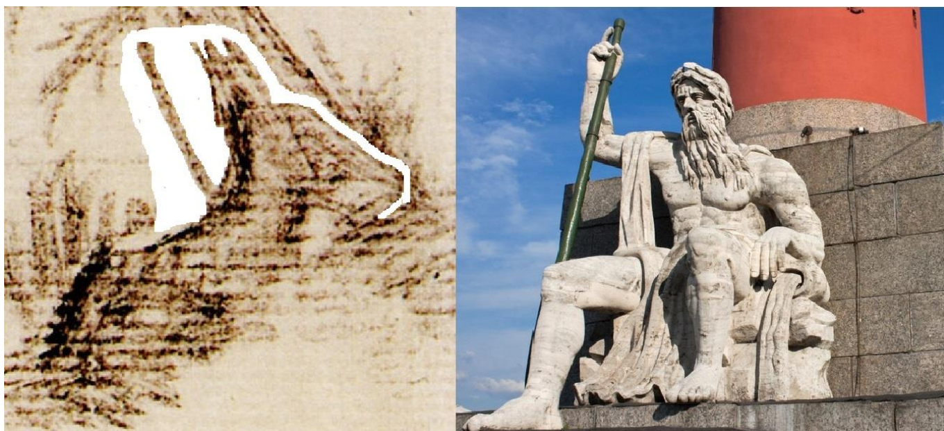
Компьютерная расчистка фигуры Вадима Новгородского на рисунке Пушкина и фигура Волхова у роstralной колонны на стрелке Васильевского острова

Фигуру привалившегося к корням ели мятежника Вадима не сразу и угадаешь. Она и впрямь «сокрыта», ибо сливается с пейзажем. Однако сделаем компьютерную расчистку: ничего не дорисовывая, лишь ослабим линии, призванные спрятать мятежника.