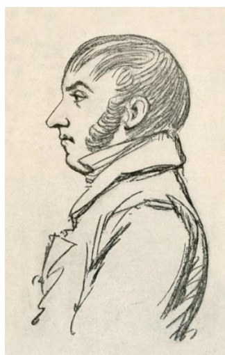
«Зориан Доленга-Ходаковский, нарисованный Ксаверием Преком в Синяеве в 1818 году для Адама Клодзинского, а тем подаренный в собрание Гвалберта Павликовского. Сходство не может быть больше».

Полагают, что он не знал, что именно он копает, и, более того, «очевидно, что ему был неизвестен летописный рассказ о могиле Олега в Ладогe» 4 . Но это ошибка. Ходаковский сообщал в печати, что хочет найти и раскопать «могилу под Ладогою, упомянутую Летописцем Архангелогородским». Нашел. И за девять дней прокопал конусом поврежденную ранее курганную насыпь, обнаружив сожженные кости, еловые, сосновые и ольховые угли, железную задвижку замка и большой наконечник архаичного двушипного 5 .