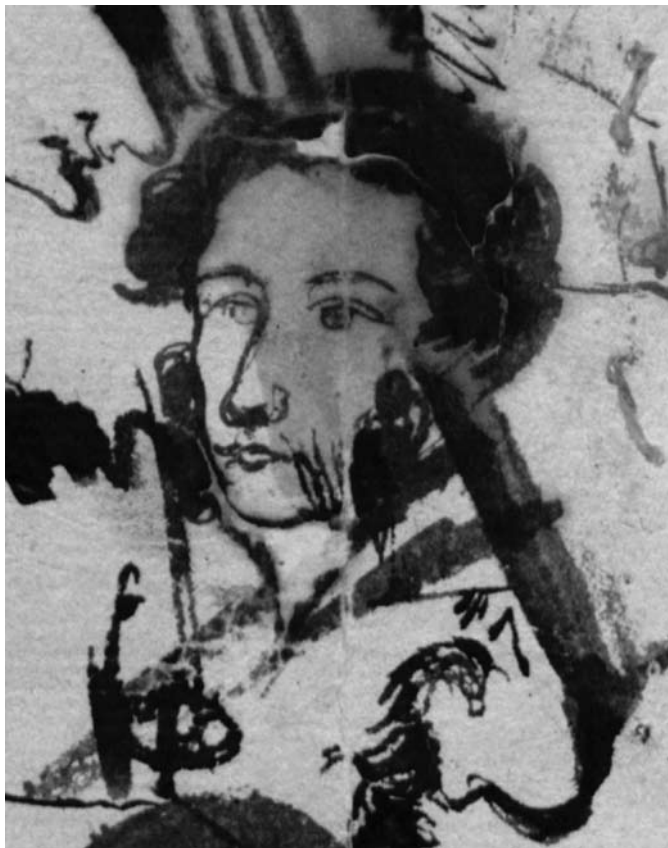
Пушкин. Автопортрет на листе с «Эскизами лиц, замечательных по 14 Декб. 825 года». Тригорское. Июль-август 1826